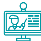
ASL a distanza