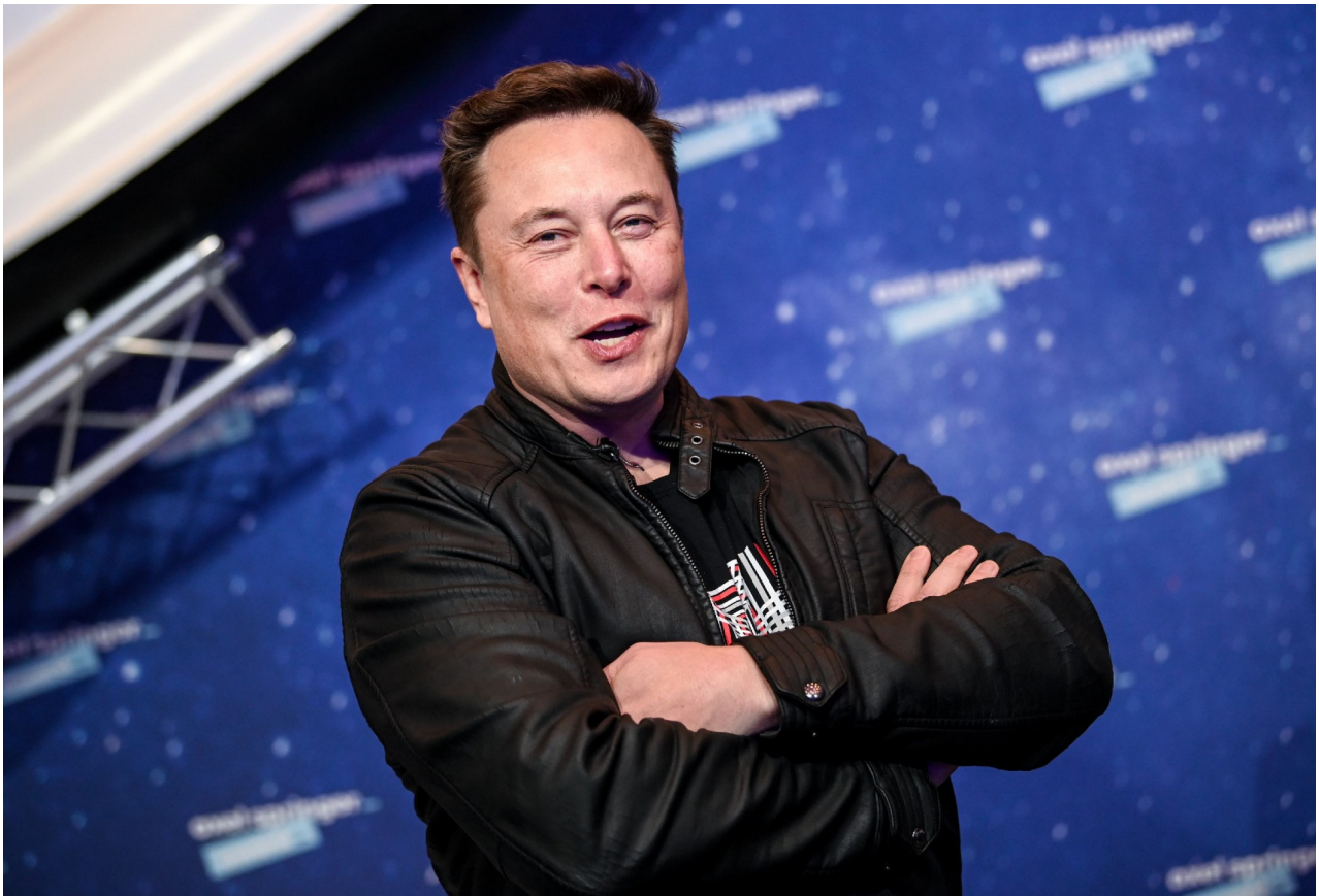
Elon Musk

Cada vez está más asentada la tesis de que el teletrabajo ha llegado para quedarse y que se va a extender a muchos sectores de actividad. Incluso hay países que, como España, han legislado sobre esta forma de trabajar. Sin embargo, en los últimos días, Elon Musk , el hombre más rico del mundo y dueño de compañías como Tesla o SpaceX, ha dejado claro que no quiere oír hablar de la posibilidad de que sus empleados trabajen desde casa .