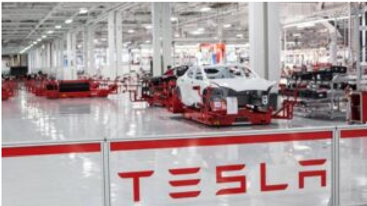
Factoría de Tesla.

En un correo electrónico de seguimiento, Musk les recordó a los empleados que dio el ejemplo durmiendo en la fábrica : “Cuanto mayor seas, más visible debe ser tu presencia. Por eso viví tanto en la fábrica , para que los que estaban en la línea pudieran verme trabajando junto a ellos. Si no hubiera hecho eso, hace mucho tiempo que Tesla habría quebrado ”.