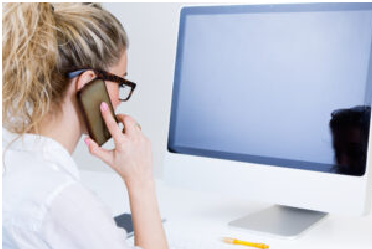
Cada vez hay más personas en España que teletrabajan.

El acuerdo para formalizar el teletrabajo o trabajo a distancia debe realizarse por escrito , bien en el momento de firmar el contrato inicial o posteriormente, pero, en todo caso, siempre antes de que se implante esa modalidad . De dicho documento hay que entregar una copia a la representación legal de los trabajadores (comité de empresa o delegado de personal).