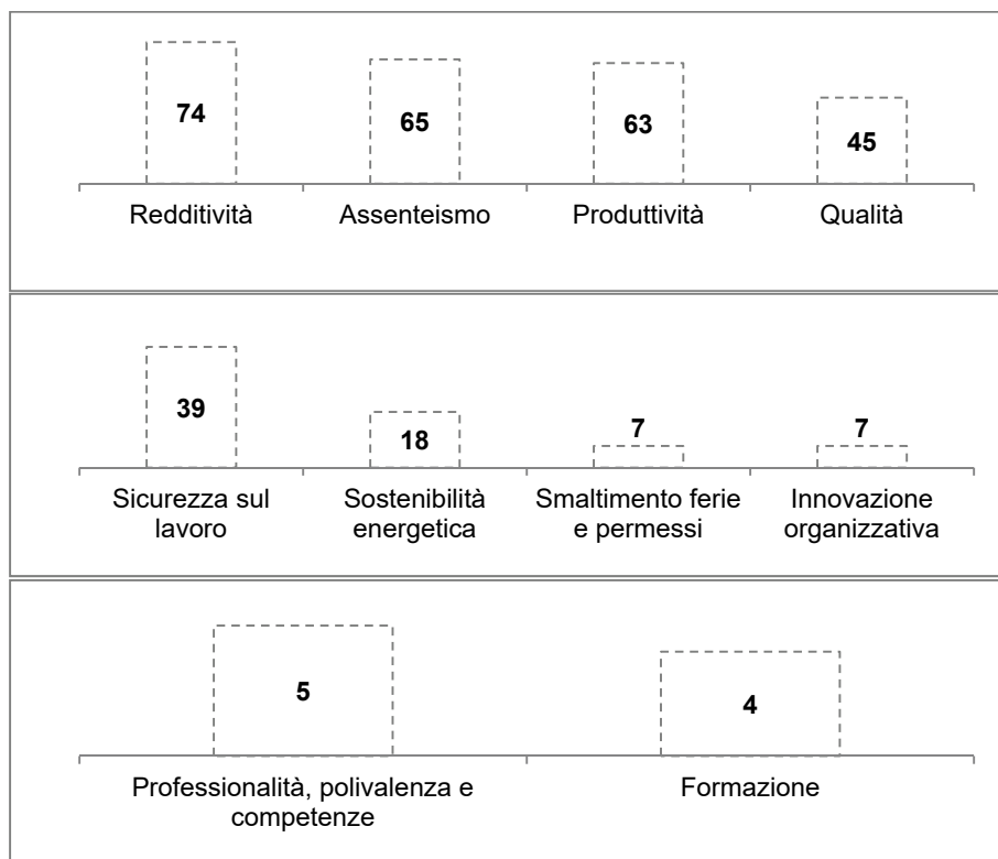
Grafico 3 – Incidenza degli indicatori rispetto al totale di accordi sul premio di partecipazione (%)