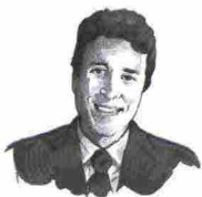
di Michele Tiraboschi*

In un anno le misure per l'occupazione di Matteo Renzi hanno generato soltanto 30 mila nuovi posti. E costeranno 15 miliardi allo Stato. Il rischio è che incidano sulla realtà quanto un tweet.