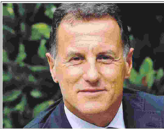
Stefano Scabbio, presidente di Assolavoro