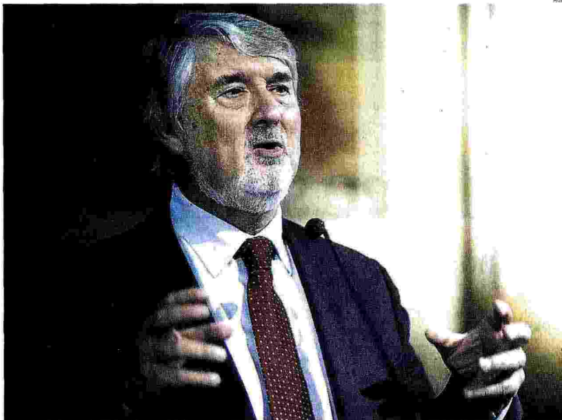
La partita del Jobs act. Il ministro del Lavoro, Giuliano Poletti

Fonte: elaborazioni Ref Ricerche su dati Istat