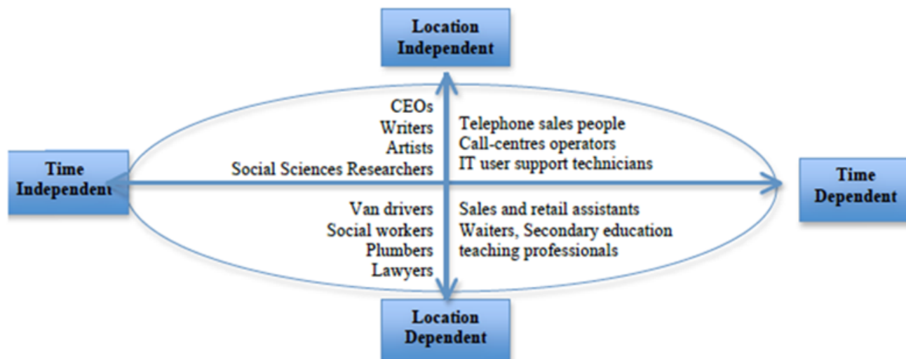
Figura 1. Dipendenza da spazio e tempo

Tuttavia, questo nuovo trend non è spinto solo dagli strumenti tecnologici o dal grado di dipendenza da luogo e tempo dell’attività lavorativa, ma è favorito dalla stessa richiesta espressa dalle future generazioni di lavoratori: oggi, quasi due studenti su tre prossimi ad entrare nel mercato del lavoro si aspettano di essere in grado di accedere alla propria rete aziendale utilizzando il proprio computer di casa, e circa la metà di essi si aspettano di fare lo stesso con i loro dispositivi mobili personali (Cisco, 2011). In altri termini, se viene garantita la possibilità di connettersi, ciascun luogo può diventare potenzialmente un posto di lavoro per una crescente