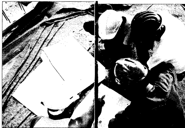
Nel grafico a sinistra, la perdita del giro d'affari di alcune categorie professionali a causa della crisi

Ed è proprio su questa debolezza che la crisi economica ha penetrato la corazza di un benessere oggi improvvisamente a rischio. Un rischio confermato dalle evoluzioni del mercato, che richiede sempre più professioni legate a servizi dal basso profilo culturale e sempre meno professionisti superpreparati e superspecializzati, aprendo così il futuro a scenari nuovi dai contorni incerti.