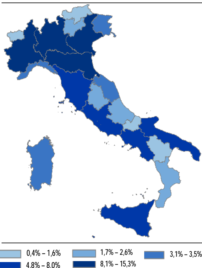
Grafico 3. Istituzioni non profit per regione. Censimento 2011, valori percentuali

Le aree che presentano una maggiore diffusione di istituzioni non profit registrano anche un bacino più vasto di risorse impiegate . Il Nord-est e il Nord-ovest registrano, infatti, il rapporto più elevato di volontari (pari rispettivamente a 1.146 e 892 per 10mila abitanti) e di dipendenti (141 e 156 per 10mila abitanti) rispetto alla popolazione residente. Approfondendo i dati territoriali, la presenza più significativa di dipendenti rispetto alla popolazione residente si rileva nella Provincia autonoma di Trento (con 193 addetti per 10mila abitanti), in Lombardia (171), Valle d'Aosta (167), Lazio (150) ed Emilia Romagna (148). Quasi la metà dei dipendenti impiegati nelle istituzioni non profit italiane (45,9 per cento) è concentrata in tre regioni: Lombardia, Lazio ed Emilia Romagna.