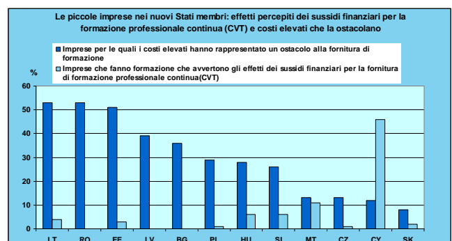
Figura 2: Effetti percepiti dei sussidi finanziari e costi elevati della formazione continua

Tutto ciò è molto deludente, poiché molti incentivi finanziari sono mirati a incoraggiare le piccole imprese a realizzare più formazione continua.