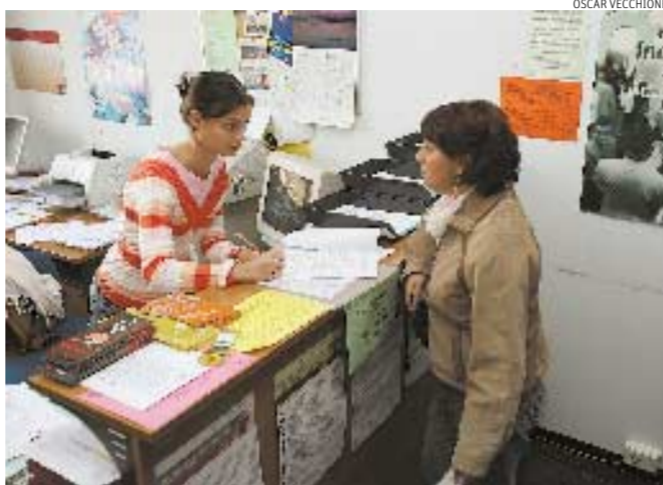
Torino. Lo sportello presso l'ufficio Job placement dell'Università degli studi