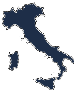
ITALIA: POPOLAZIONE IN ETA' LAVORATIVA 39,2 milioni