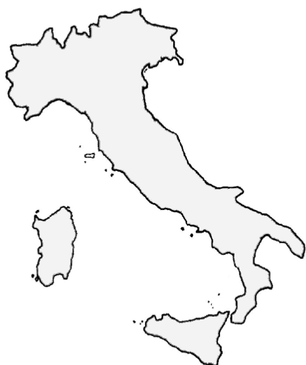
ITALIA: POPOLAZIONE 60,7 milioni