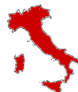
ITALIA: PERSONE CHE LAVORANO 22,3 milioni

Per una grande Italia (e per la sostenibilità del welfare) sono troppo pochi quelli che lavorano