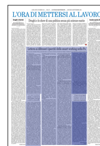
Peso: 1-3%, 8-52%

Il terzo abbaglio, conseguente, riguarda il presunto aumento di produttività delle pubbliche amministrazioni. Chi produce statistiche sullo smart working emergenziale nella Pa da quali dati attinge? Al momento non possediamo una panoramica completa delle informazioni relative all'andamento della produttività collegata al lavoro agile nel 2020. E non la abbiamo per i motivi elencati sopra: è mancata la programmazione, è mancata la definizione dei target e degli obiettivi e sono mancati gli strumenti informatici per la raccolta e analisi dei dati e per il monitoraggio dei risultati raggiunti. Piuttosto abbiamo registrato lamentele da parte di imprese e cittadini che hanno sperimentato (comprensibili) ritardi nella loro interlocuzione con le amministrazioni pubbliche, a causa della mancanza di personale sul posto di lavoro. Dunque nessuno è in condizioni di dipingere un quadro attendibile dall'esperienza che ab-