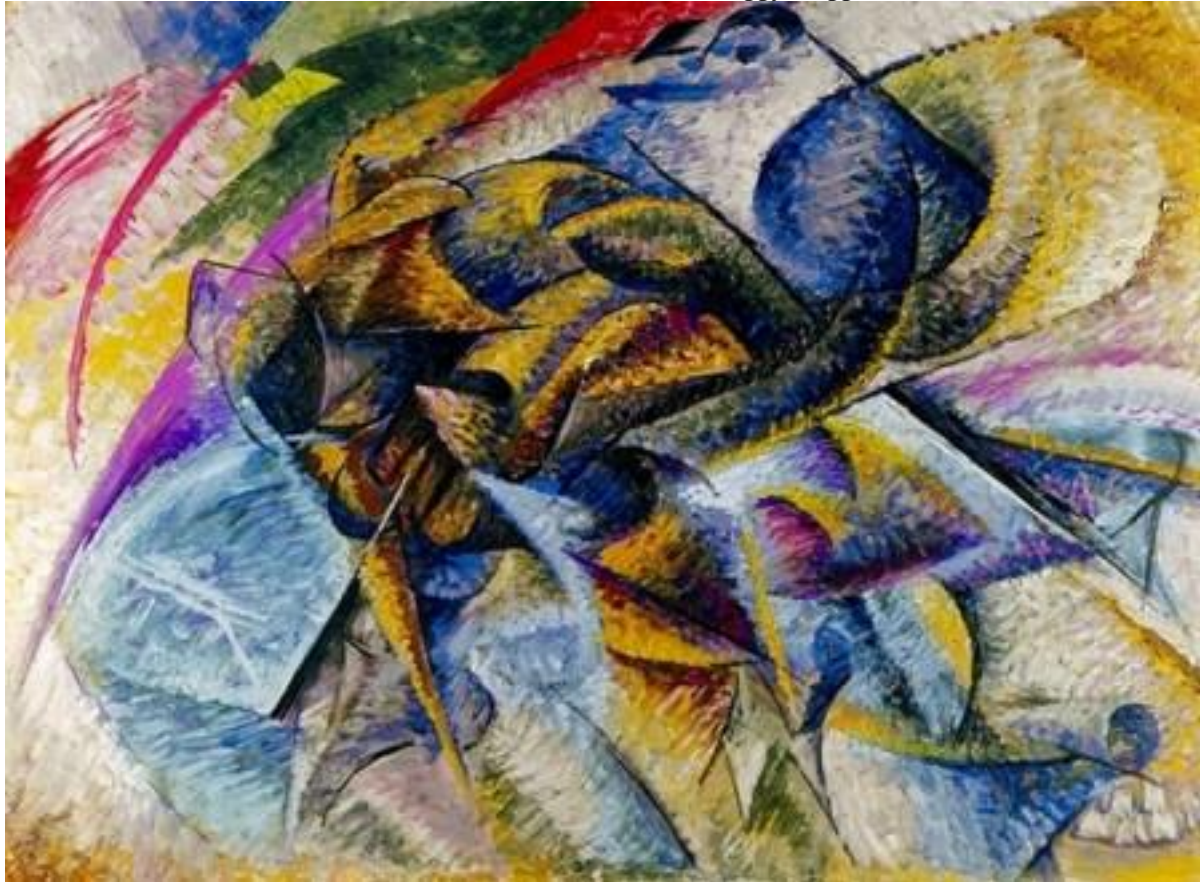
Umberto Boccioni, Dinamismo di un ciclista , olio su tela, 1913. Peggy Guggenheim Collection, Venezia.