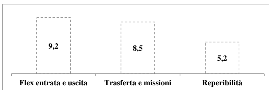
Grafico1: Istituti dell'orario di lavoro(%)