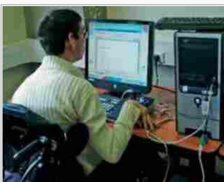
Un Decreto attuativo del cosiddetto "Jobs Act" presenta novità per i lavoratori affetti da gravi patologie cronico-degenerative ingravescenti

Il Contratto Collettivo Nazionale di Lavoro (CCNL) del Comparto Ministeri (articolo 21, comma 7 bis) stabilisce: «In caso di patologie gravi che richiedano terapie salvavita ed altre ad esse assimilabili secondo le indicazioni dell'ufficio medico legale della azienda sanitaria competente per territorio, come ad esempio l'emodialisi, la chemioterapia, il trattamento per l'infezione da HIV- AIDS nelle fasi a basso indice di disabilità specifica (attualmente indice di Karnosky), ai fini del presente articolo, sono esclusi dal computo dei giorni di assenza per malattia i relativi giorni di ricovero ospedaliero o di day – hospital ed i giorni di assenza dovuti alle citate terapie, debitamente certificati dalla competente Azienda sanitaria locale o struttura convenzionata. In tali giornate il dipendente ha diritto in ogni caso all'intera retribuzione prevista dal comma 7, lettera a)».