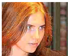
Ventimila dollari per un film porno, nuova proposta hard per