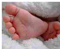
Una speranza per la piccola Vittoria, potrebbe ricevere il