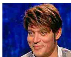
"La metamorfosi di Garko? Un ritocco sbagliato"