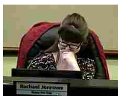
Va in bagno con il microfono acceso, imbarazzo per un