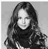
La modella bambina più bella del mondo - FOTO (Excite Donna)