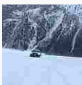
Il video che sta facendo impazzire il web: un'Audi in discesa sulle piste di Campiglio (Audi su Youtube)

quello degli altri (e del proprio) di Kalaris