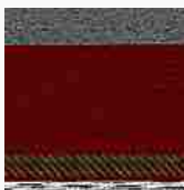
Playa, Licata. Provincia di Venezia