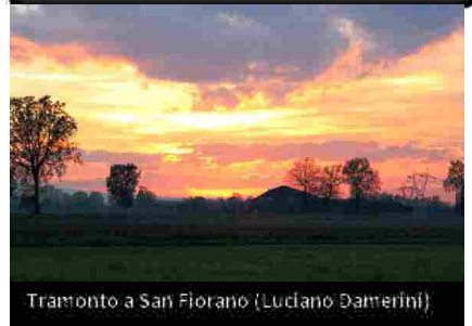
Tramonto a San Fiorario (Luciano Damerini)