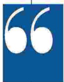
Cesare Damiano

Damiano (Pd): «Bisogna trovare 400 milioni per estendere gli ammortizzatori sociali»