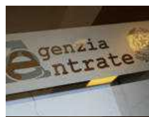
Sogei, se il cliente soddisfatto è il proprietario