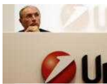
Banche, per Natale un regalo da 4 miliardi