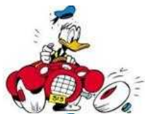
Se il ticket del parcheggio è scaduto la multa è illegittima