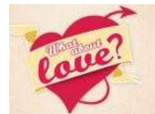
What about love