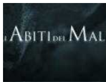
Gli abiti del male