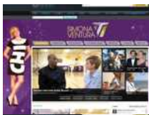
Simona Ventura Tv: la web-tv in esclusiva su