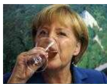
La Germania aumenterà la spesa mentre chiede asuterity