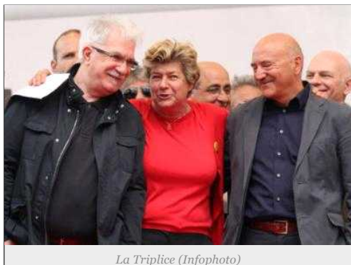
La Triplice