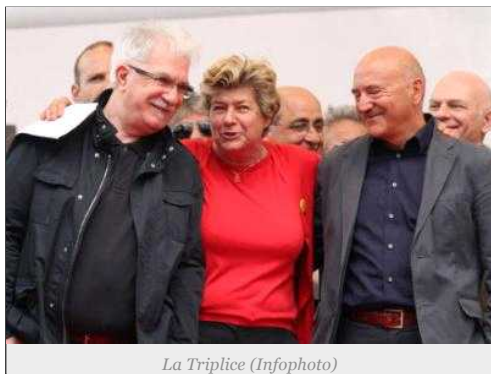
La Triplice