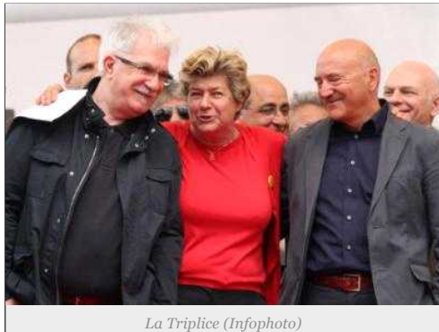
La Triplice