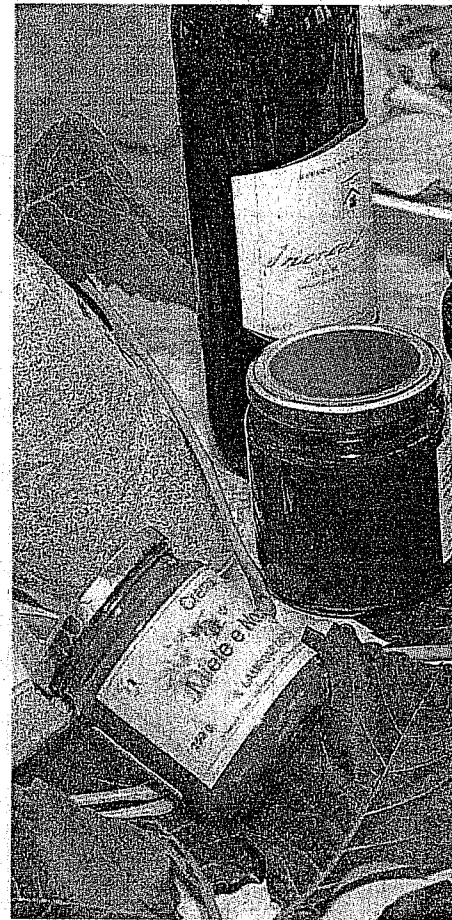
Prodotti tipici per rilanciare l'identità del territorio

«Gli ambienti - continua Radicchi - sono ideali anche per ospitare un centro didattico e un punto di esposizione e vendita dei prodotti prove-