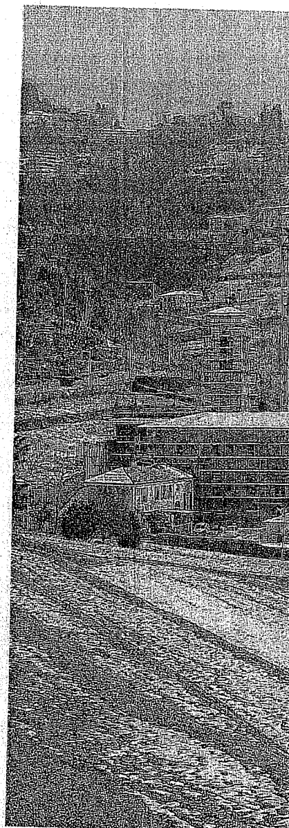
I campi imbiancati di neve attorno al monastero agricolo