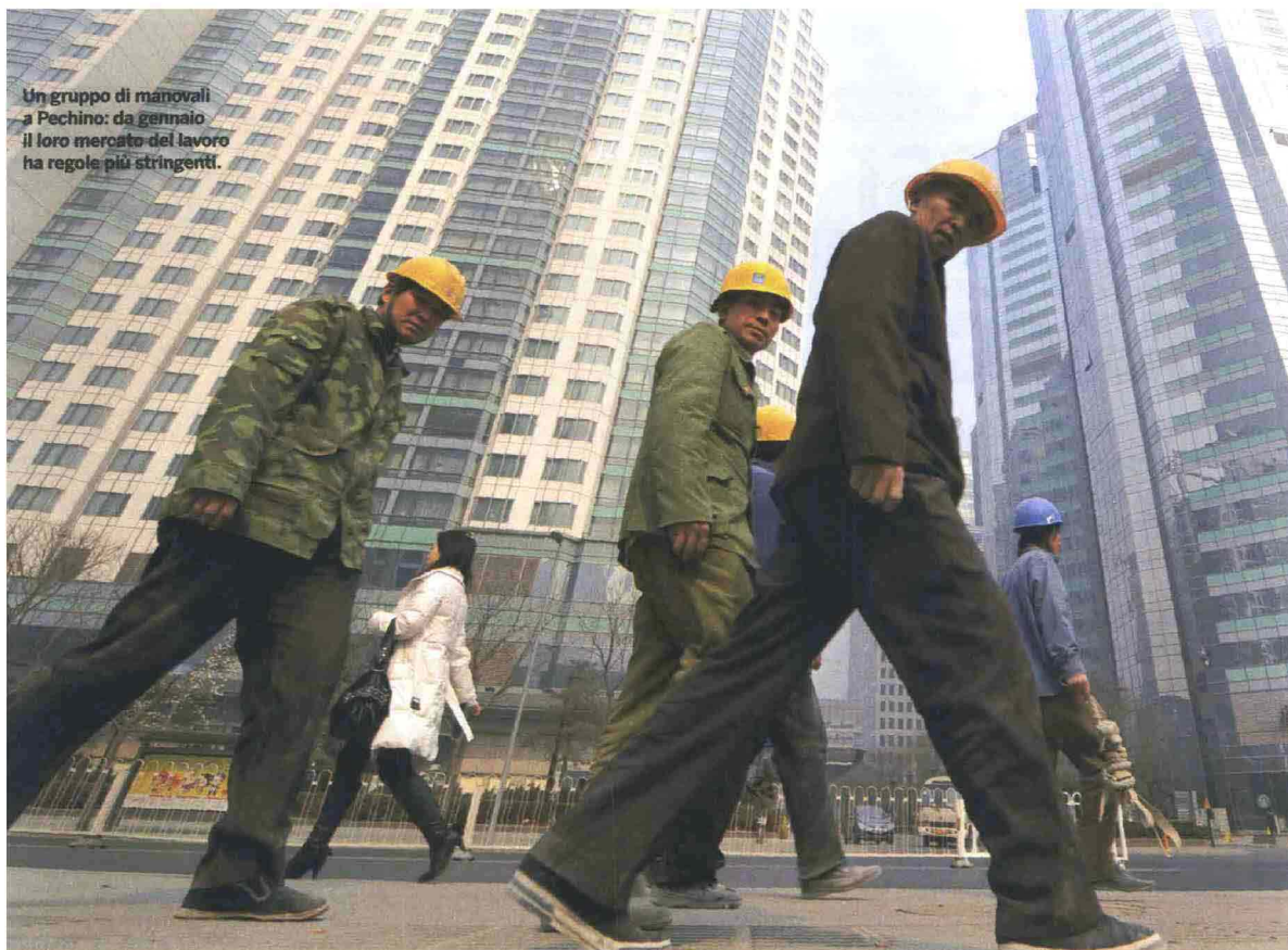
Un gruppo di manovali a Pechino: da gennaio il loro mercato del lavoro ha regole più stringenti.