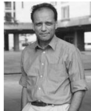
Partha Dasgupta University of Cambridge