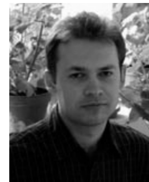
Vladislav Valentinov Martin-Luther University in Halle-Wittenberg