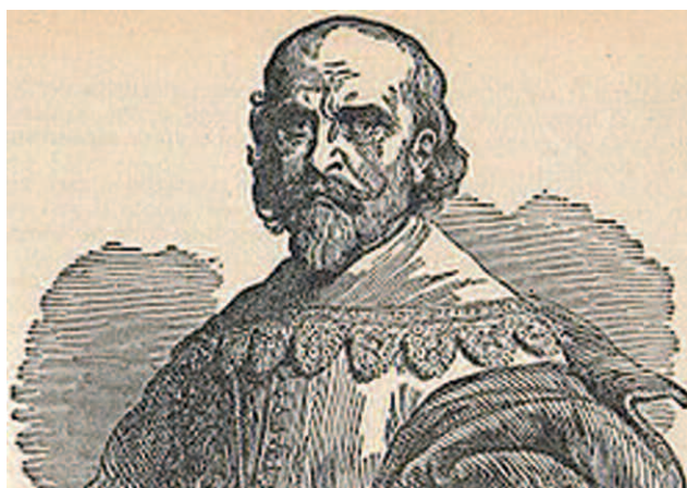
Quattro illustrazioni dei "Promessi sposi". Nella pagina a fianco, Alessandro Manzoni

impone, esigente e severo, la dimensione politica e collettiva della giustizia. E tutto si riassume nell'ultima opera, ormai quasi sconosciuta, e pubblicata postuma e incompiuta: La Rivoluzione Francese del 1789 e la rivoluzione italiana del 1859, Osservazioni comparative (questo il titolo originario). Qui Manzoni, che accetta e riconosce il diritto dei popoli alla rivoluzione, si propone di descrivere la superiore "qualità" del Risorgimento nazionale, contrapposta agli errori e agli orrori seguiti all'"Ottantanove" francese. Perché, nell'analisi minuziosa dei mesi cruciali della Bastiglia e con fonti di prima mano raccolte anche nella sua giovanile vita parigina, pone comunque l'interrogativo centrale sul senso etico del potere: «...essere bene amministrati non è una ricompensa che i popoli meritano per le loro buone qualità; è il loro diritto ed è il dovere di chiunque sia incaricato del loro governo... e un governo qualunque, o sia in mano d'un solo o di più, ereditario o elettivo, stabile o provvisorio, come si vuole, non fa che il suo dovere facendo ai governati tutto il bene che può...».